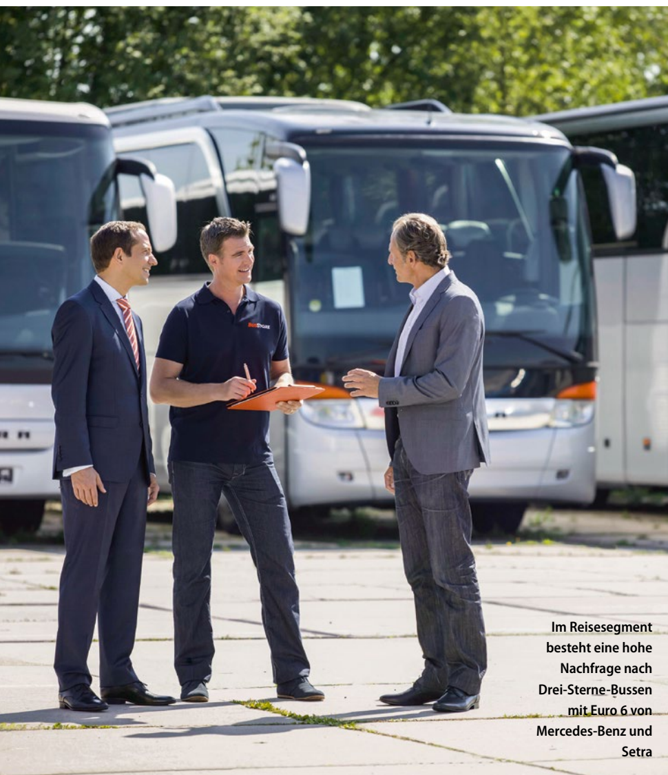
Im Reisesegment besteht eine hohe Nachfrage nach Drei-Sterne-Bussen mit Euro 6 von Mercedes-Benz und Setra

Einseitig geführte Umweltdiskussion. Den Hype um Euro 6 kann Leonhard Sigel jedoch nicht nachvollziehen. Er hat die Erfahrung gemacht, dass Euro-4-Busse durchaus in Deutschland ihre Abnehmer finden, vor allem, wenn sie gut gepflegt seien. Und auch Euro-5-Fahrzeuge sieht er hierzulande noch nicht auf dem Abstellgleis: „Fakt ist, dass auch ein Euro-5-Fahrzeug, das einen Bus mit schlechterer Abgasnorm ersetzt, einen wichtigen Beitrag zum Umweltschutz leistet“, sagt er. Bei aller Dringlichkeit für guten Umweltschutz hofft er, dass diesbezügliche Diskussionen künftig weniger einseitig geführt würden. „Es wäre schön, wenn möglichst alle Faktoren, von der Rohstoffgewinnung über Transport, Produktion, Lebensdauer und Recyclingaufwand, Berücksichtigung und Wertung finden würden“, findet der Händler.