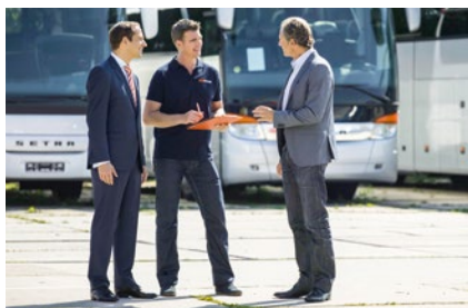
Welche Preise Gebrauchtbusse erzielen – Seite 6

Das betrifft vor allem Fahrzeuge unterhalb der Abgasnorm Euro 6, die in der EU immer schwerer einen Käufer finden, zumindest zu einem für den Händler akzeptablen Preis. Zu groß ist mittlerweile der Druck durch Politik und Umweltschützer.