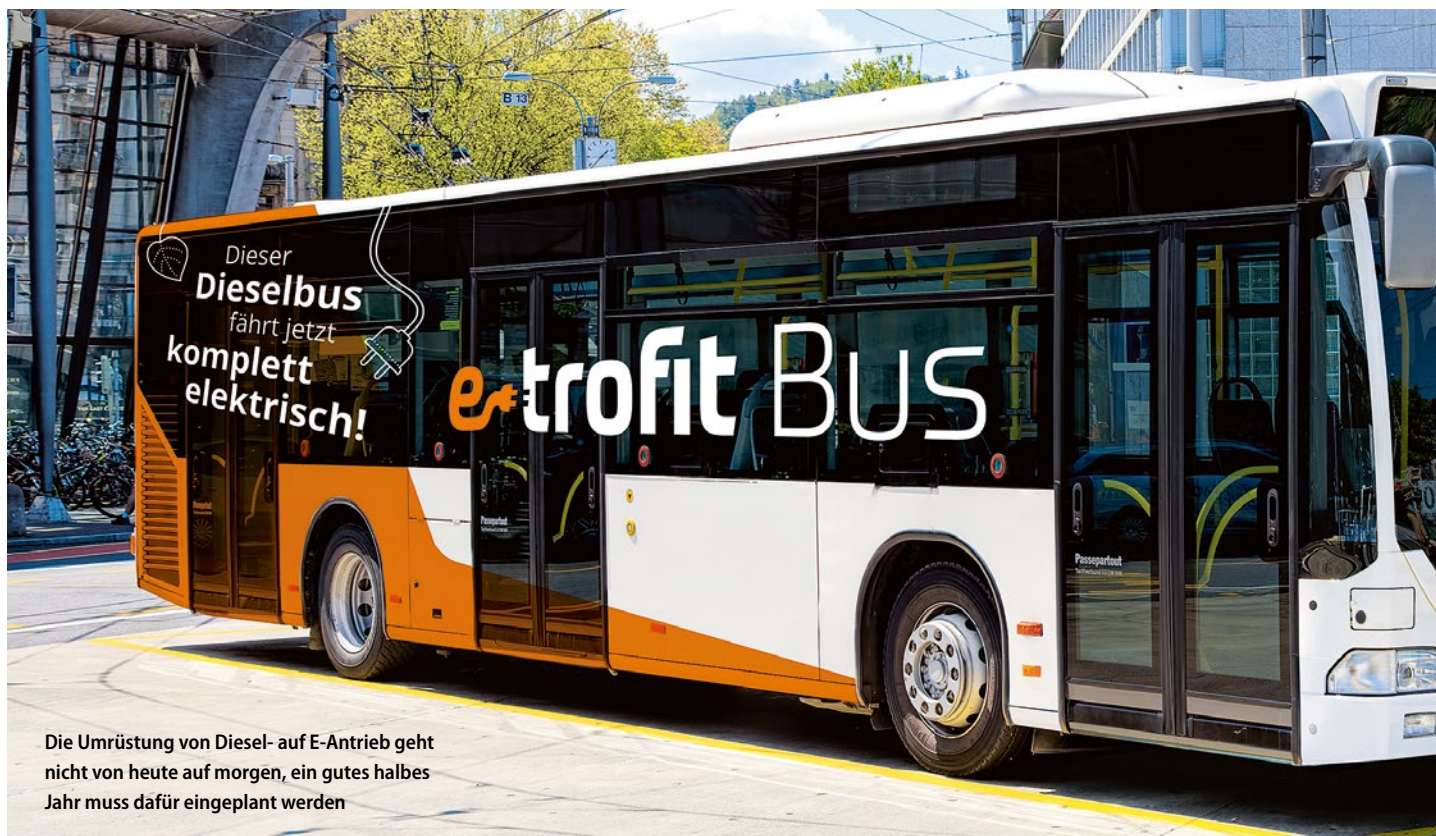
Die Umrüstung von Diesel- auf E-Antrieb geht nicht von heute auf morgen, ein gutes halbes Jahr muss dafür eingeplant werden